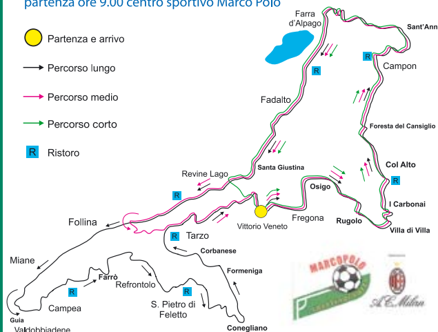
Gran Fondo del Prosecco 2008

18 Maggio 2008 città di Vittorio Veneto partenza ore 9.00 centro sportivo Marco Polo